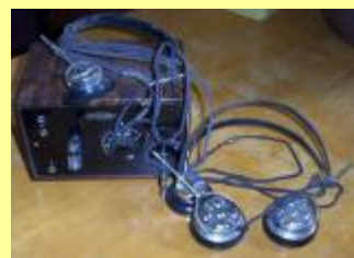
Rundradion börjar komma igång. Hörlurar används för att lyssna.