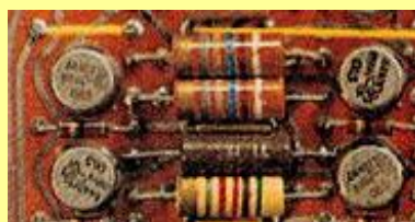
Transistorn och FM revolutionerar radiotekniken