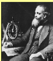
Maxwell formulerar teorier om elektromagnetisk strålning