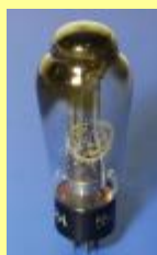
Lee de Forest uppfinner trioden. Den kallas också Audion