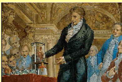
Volta demonstrerar det första batteriet, Voltas stapel