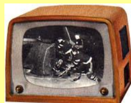
Officiella TV-sändningar startar i Sverige