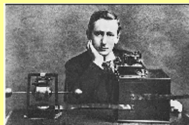
Marconi demonstrerar en utrustning för trådlös telegrafi