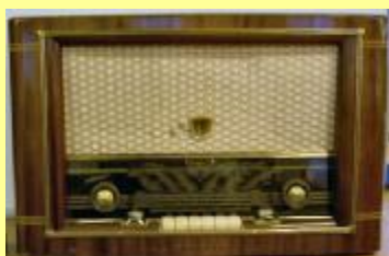
Högtalarna blir bättre och apparaterna får skalor för olika stationer.